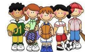
Fordeling av jenter og gutter